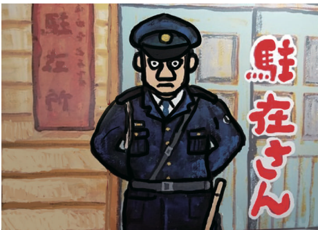
敗戦後の暮らしを描き、亡き父を描いた人生紙芝居。 脚本 / 絵：本多ちかこ